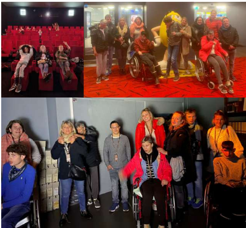
Petites vacances à Charmey pour les Fontenattes et l'Accueil de jour de Porrentruy

« Il faut prendre conscience de l'apport d'autrui, d'autant plus riche que la différence avec soi-même est plus grande » (Albert Jacquard)